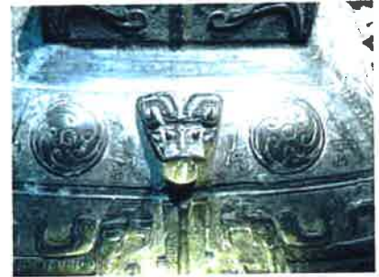
Détail d'un vase rituel (environ 400 av-JC)

Ces objets avaient des fonctions rituelles et étaient inhumés dans les tombes des hauts dignitaires. Par exemple, plus de 6200 de ces objets en bronze constituaient une partie du mobilier funéraire du Marquis Yi de Zeng (vers 433 av-JC). Les dynasties suivantes voueront un culte nostalgique à ces deux périodes de la Chine ancienne et à ces objets.