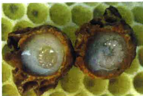
Deux cellules royales montrant des larves d'abeilles dans de la gelée royale

La gelée royale contient des sucres, des protéines, des graisses. Son ingrédient principal est l'eau. La gelée royale est également composée de vitamines (du groupe B essentiellement) mais aussi de minéraux, et d'oligo-éléments. C'est donc un aliment très complet.