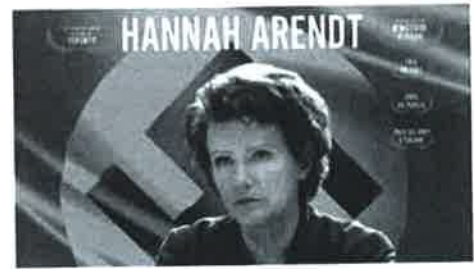
Affiche du film Hannah Arendt de Margarethe Von Trotta