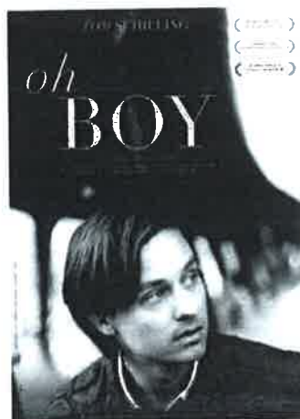
Affiche du film Oh boy de Jan Ole Gerster

Ce texte est d'une extrême violence, voire grossier, en même temps que prophétique. En effet, huit années plus tard, comme le pressentait François Béranger, le mur de Berlin s'effondrait.