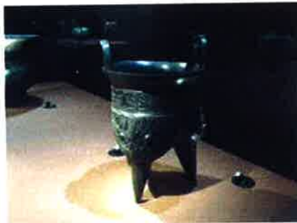
Tripede pour les offrandes d'aliments (environ 750 av-JC)

L'exposition respecte cette chronologie et des panneaux à l'entrée de chaque salle expliquent très clairement le contexte artistique, religieux et politique de chaque époque. Il ne reste plus qu'à admirer les pièces présentées dans un décor noir. Un simple éclairage de chaque objet suffit à mettre en valeur sa patine et les détails de son décor.