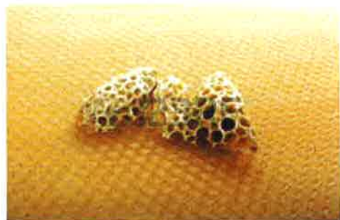
Cellules contenant de la gelée royale