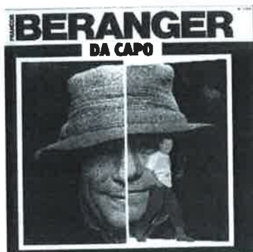
Pochette de l'album "Da Capo" dont est extraite la chanson

Tout ce travail de réflexion, de participation et d'écoute m'a remis en mémoire la chanson « poème » d'un auteur, François Béranger, écrite en 1981 (voir paroles page précédente).